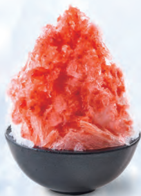
栃木県産 とちおとめ