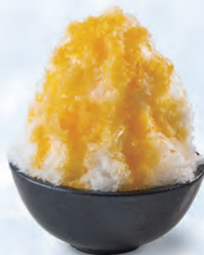
愛媛県岩城島産 島みかん