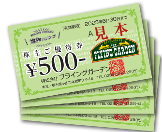
当社株主ご優待券

※店舗でのお食事代、テイクアウトのお弁当代、ギフト商品、レジ前物販のお支払にご利用できます。